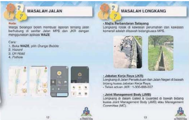
■也许很多人不知道，道路损坏问题（左）可透过Waze手机应用程序来投诉。