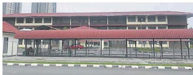
加影新城华小在 2017 年已建竣。

加影新城华小建委会在 11 月 20 日向加影市议会提呈“建筑落成与完工准证”, 在一个月內获得市议会批准。