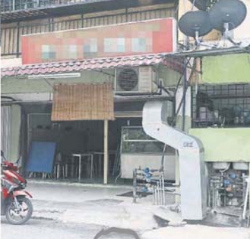
■一些餐饮业者违例扩建，把厨房废气排到沟渠。