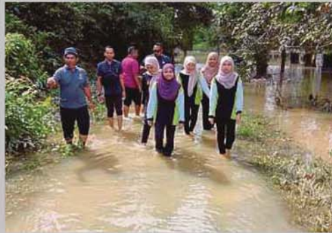
PENUNTUT UiTM Puncak Alam meredah bah termenung di Kampung Seberang Batu Badak, Segamat.

Provided for client's internal research purposes only. May not be further copied, distributed, sold or published in any form without the prior consent of the copyright owner.