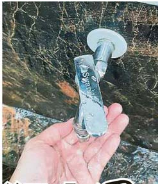
接下来的华人新年又要重演制水问题。受访居民对突然制水问题感到厌烦，他们不希望