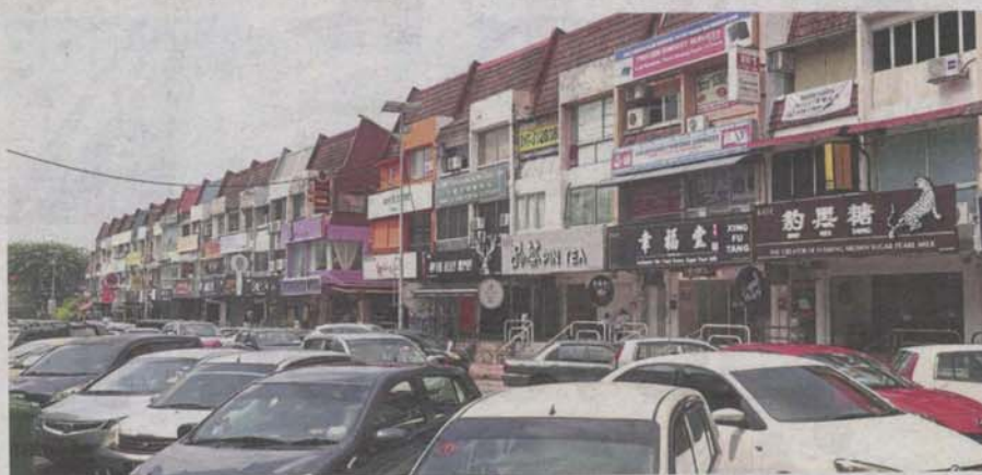
Subang Jaya municipality has many bustling commercial areas.

Subang Jaya will become the third city council in Selangor, after Petaling Jaya and Shah Alam