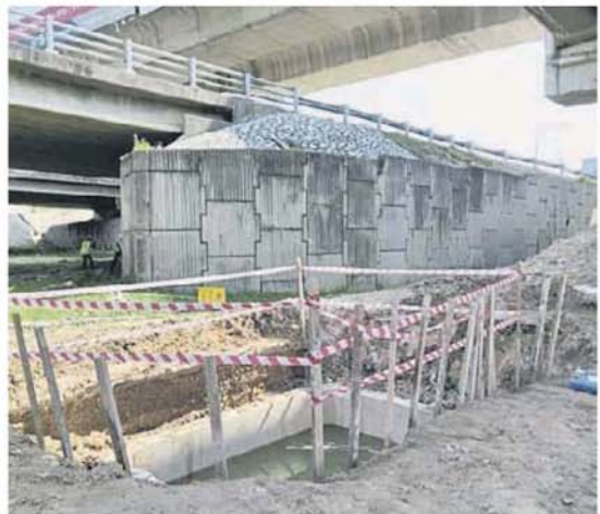
■表面上看似简单的道路损坏，其实涉及不少单位，包括下水道、国能电缆等，因此问题无法在三两天内解决。

霍韦彬指出，居民除了透过投电投报，也可透过市议会官网、传真、亲临市议会和手机应用程序来作出投。