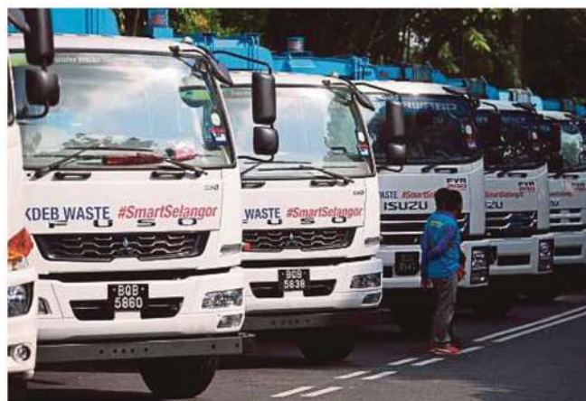
DERETAN lori kontraktor KDEB Waste Management bagi kutipan sampah domestik pada majlis penyerahan di Dataran Kemerdekaan Shah Alam, semalam.

Provided for client's internal research purposes only. May not be further copied, distributed, sold or published in any form without the prior consent of the copyright owner.