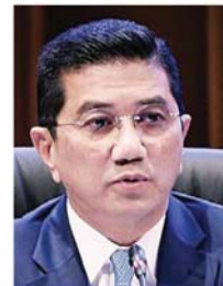
阿兹敏阿里：我国明年有望实现4.8%国内生产总值增长。

他也说，从2020年1月1日开始，57个地区的最低薪金也将提高至1200令吉。#