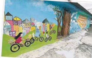
这幅壁画从左至右，象征双溪威市进入双溪威，各校一起骑脚踏车前往庆祝双溪威70周年。