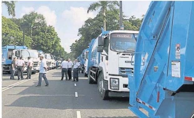
达鲁益善公司把 56 架垃圾车及一架自卸垃圾车移交莎阿南市政厅。

黄思汉表示, 过去 3 年, 达鲁益善公司在雪州 11 个地方政府进行清洁工作, 而莎阿南在明年 1 月 1 日起, 将会是该公司接手的第 12 个地方政府, 届时整个雪州的清洁工作将完全交予达鲁益善公司。