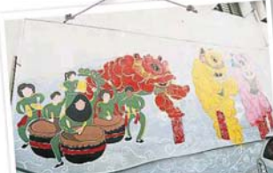
墙上的高板击球是刚获得全国冠军的群乐体育会的舞狮队，画得非常生动。