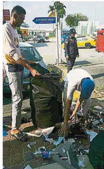
市议会出动共16名官员参与行动，包括清理家具维修店遗留在外的垃圾。