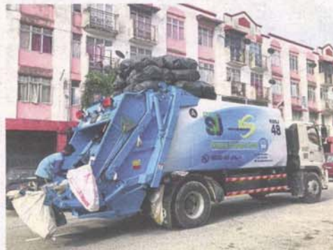
Rubbish collection is one of the main concerns of MPSJ residents.

"We see less frequent waste collection and public cleaning and when we ask the contractors, they say it is due to budget cuts."