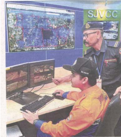
Ratepayers will be expecting improved services from MPSJ following the upgrade.

Provided for client's internal research purposes only. May not be further copied, distributed, sold or published in any form without the prior consent of the copyright owner.