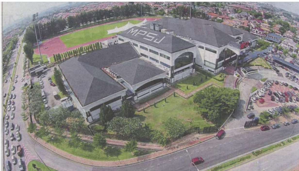
Bird's eye view of MPSJ in USJ 5 which is set to become a city council next year.

Provided for client's internal research purposes only. May not be further copied, distributed, sold or published in any form without the prior consent of the copyright owner.