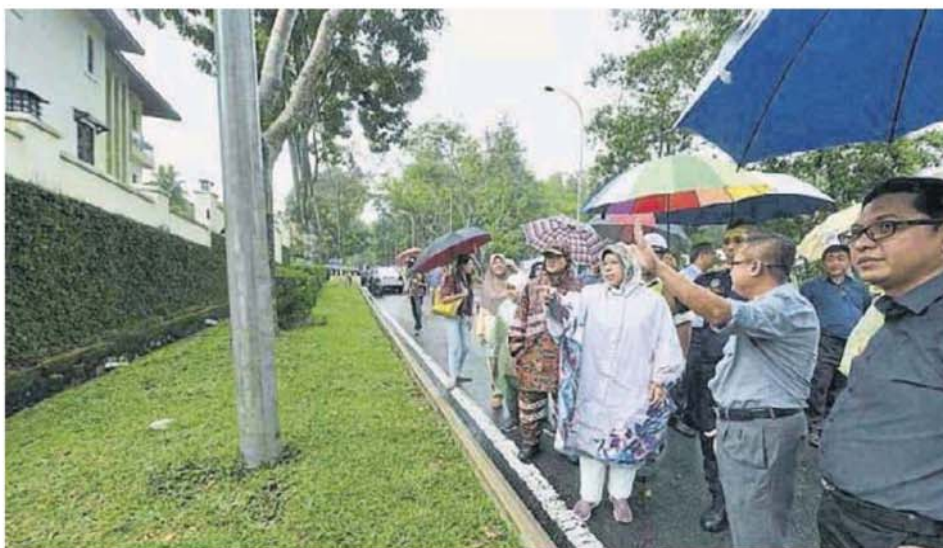
■ 祖萊達（白色雨衣者）在居民及官员的陪同下，前往发生土崩的住家巡视。

她今日巡视该住家召开记者会时说，住户必须搬离住家，当局才能把崩塌的土地重新压平稳固。