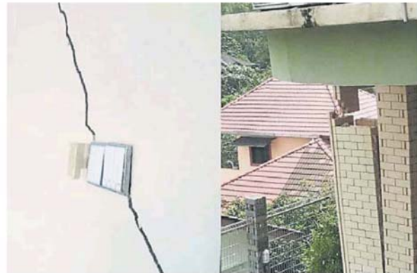
从屋子外明显看到多处裂痕。