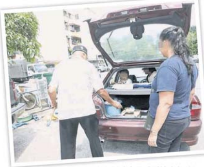
■有的人把垃圾載到当地垃圾槽丢弃。