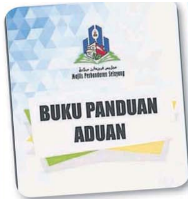
■士拉央市议会制作册子，详细说明问题的分类、投诉管道和联络方式等。