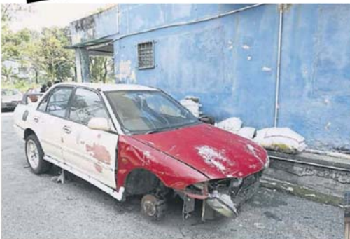
■班丹美华组屋有很多废置汽车，停泊在泊车位，霸占已不足的泊车位。