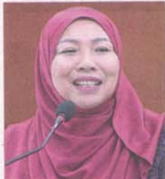
Noraini says Subang Jaya has fulfilled all 12 criteria for city status.

the strengths and weaknesses in urban areas, and the mayors or council presidents must include it in their key performance indicators (KPI).