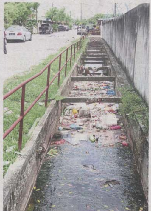
Rubbish clogging monsoon drains in Klang. Residents want the contractors appointed by MPK to do their jobs properly.

One of MPK's proposals to refurbish an old part of the city ran into problems with heritage conservationists. Plans to restore the neglected Chetty Padang in Jalan Bukit Jawa and turn it into a public square were generally welcomed but there was an