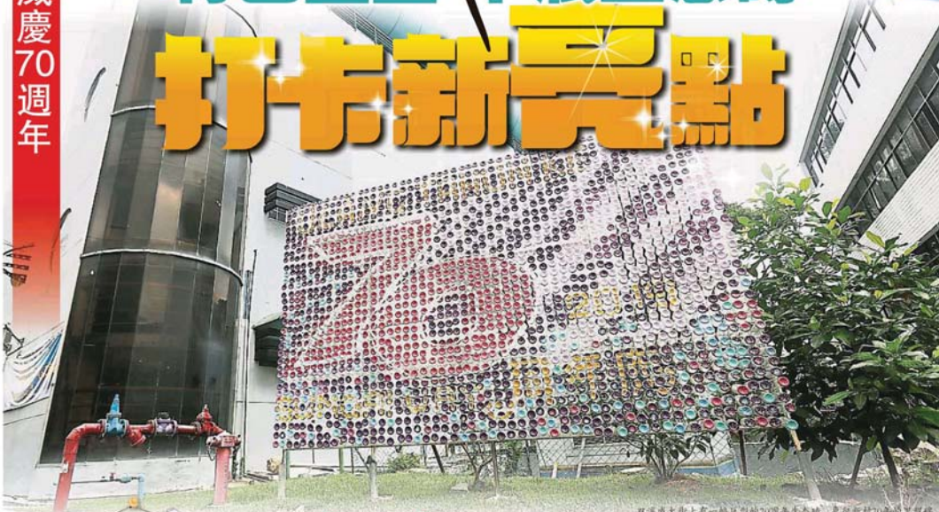
双溪威大街上有一幅巨型的70周年生态砖，象征新村70周年新里程碑。