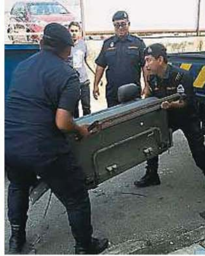
↑执法人员将造成阻碍的旧家具移走。