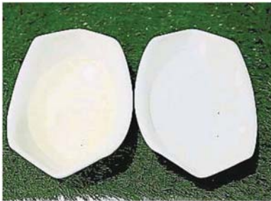
沙登区的居民投诉，虽然水供已全面恢复，惟自来水有着一股难闻异味。图为沙登区在9月尾制水及恢复水供后，居民面对水供浑浊及有异味问题。（档案照）

Provided for client's internal research purposes only. May not be further copied, distributed, sold or published in any form without the prior consent of the copyright owner.