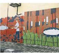
在宝手路手作坊，天生亮眼的壁画，是当地工匠与后代们共同创作的。