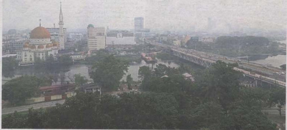
An aerial view of Klang city blanketed by thick haze in September.

Rubbish collection, traffic issues and haze kept MPK busy