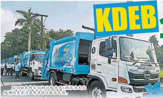
KDEB共移交56辆垃圾车及1辆滚动式垃圾槽给负责沙亚南市的垃圾承包商。