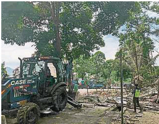
取缔行动耗时3个小时完成，市议会共出动24名官员及神手展开行动。

Provided for client's internal research purposes only. May not be further copied, distributed, sold or published in any form without the prior consent of the copyright owner.