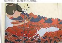
这幅“饮水思源”壁画主要是要让村民记得以前是靠采矿及割胶为生。

“我们要推动双溪威的旅游业，吸引更多人才，也会带动这里的商家生意，就如巴刹楼上有许多美食，但没有人来。食客来去都是村民，会让小贩觉得没有动力，因此必须推广让更多人知道。”