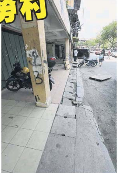
■破烂不堪的沟渠，有的部分还被密封，无法顺利打开清洗沟渠。