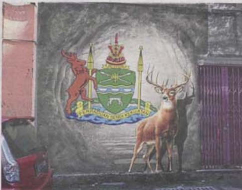
A mural of a deer adorning the wall of one of the back lanes in South Klang.