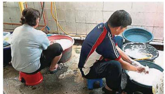
士毛月新村茶室的净水没有出现异味或泥黄色问题，水供正常。

他指出，虽然水供在几天前已恢复，可是自来水带有泥黄色，冲凉后也会感到不适，希望早日恢复净水。